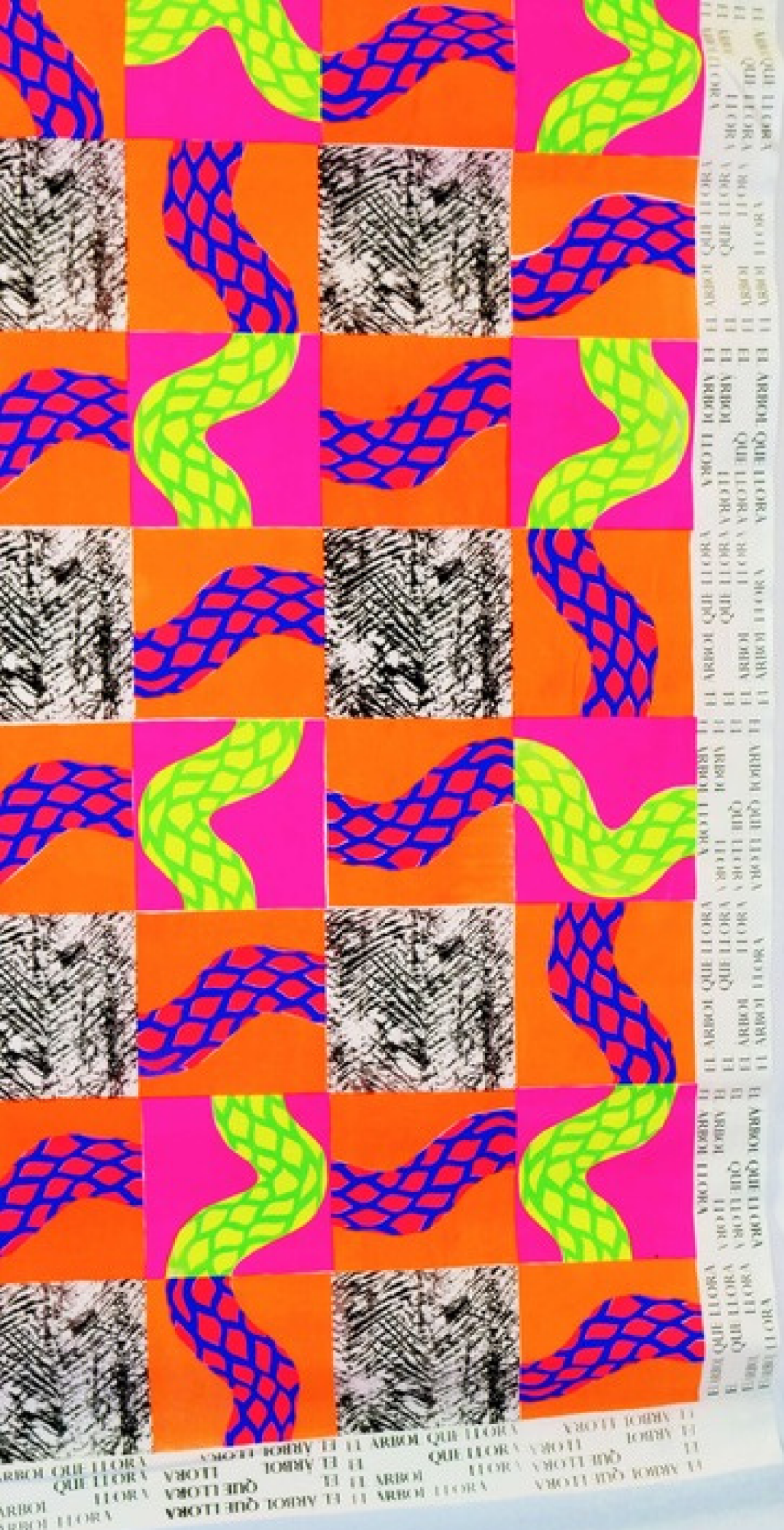
NAHOMI DEL AGUILLA, El Arbol que llora , (L'arbre qui pleure) sérigraphie textile

“La forêt est incomprise et souvent maltraitée, elle est pourtant au coeur de la vie de notre planète, et elle est indispensable à la survie de l'humanité.”